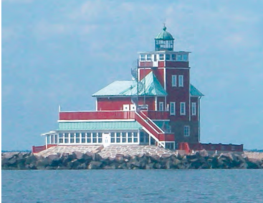
På väg till Oskarshamn passerade vi Dämmans gamla fyr och lotsplats. Idag har den byggts om till ett sagolikt vattenhotell.

ser ut som ”kommet ur sagans värld”. I Oskarshamn studerade vi bl.a. Döderhultarens träsniderier. Fantastiskt uttrycksfulla men också tillverkade i stor kvantitet. Det sägs att Oskarshamnsborna ibland använde konstverken som tändved!